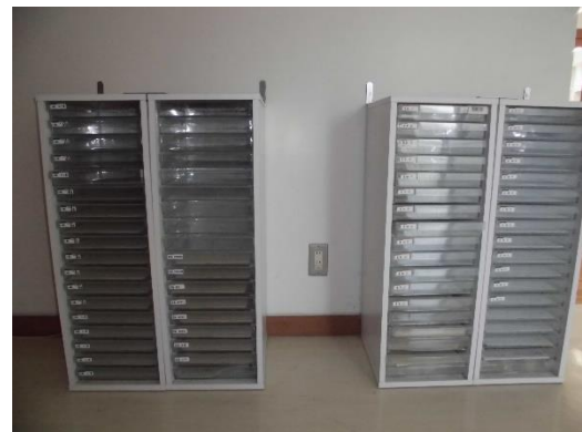
各階のボックスに保管