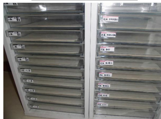
基礎的な問題、発展的な問題に分けて児童が選択しやすくする。