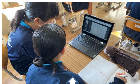
生徒同士対話をしながら、課題解決をする姿

受験生や長欠生徒への個別指導の際に【問題を解く→説明する】という学習活動で活用した結果、知識定着につながった。やる気を引き出し目標を持たせ継続支援をすることができた。