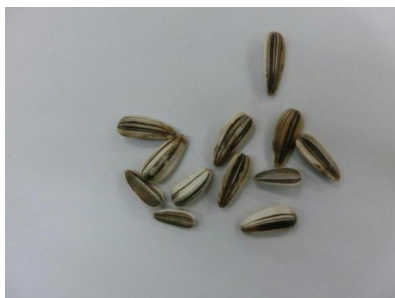
( ヒマワリ )