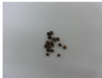
( ホウセンカ )