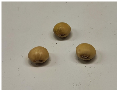
( ダイズ )