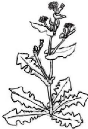
( ノゲシ )