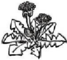
( タンポポ )