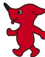
千葉県マスコットキャラクター 「チーバくん」