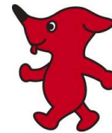
千葉県マスコットキャラクター 「チーバくん」