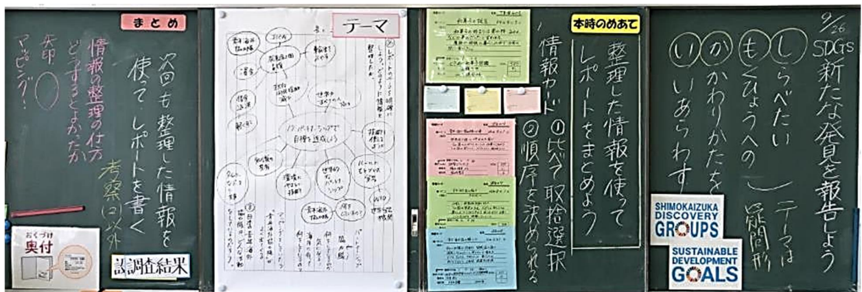
図5 本時の板書（学校図書館）5／8時間目

エ 学習の記録（図2）を工夫したことにより、生徒の学習状況が把握でき、必要な支援、指導をすることができた。