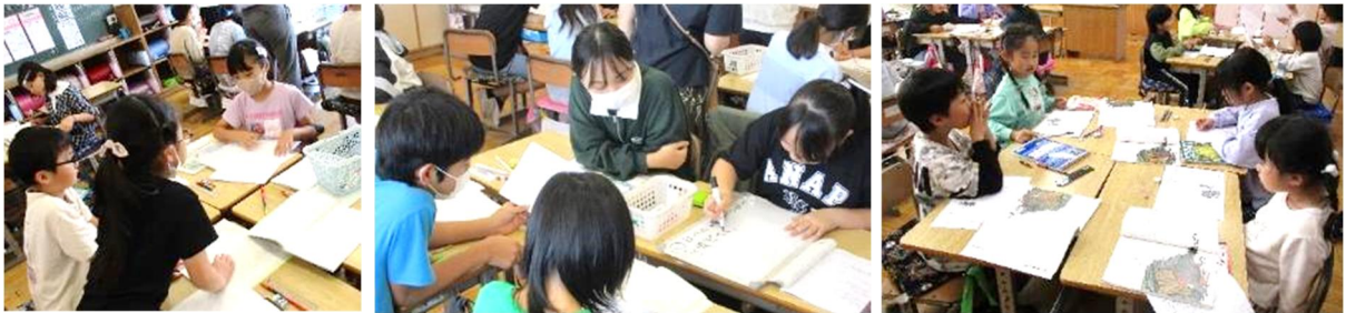
【写真1 考えを深めるために行った話し合い活動】

表現する力を身に付けることが大前提にあると考え、「自分の考えをもち、主体的に伝え合う児童の育成 ～言語能力の向上に焦点を当てて～」というテーマで今年度研究に取り組んだ。2・4・6年生では、①②の両方を身に付けるために、自分の考えをもつ時間を確保し、それをもとにグループで話し合うことで、自分の考えを分かりやすく相手に伝えたり、より考えを深めたりすることができた(写真1)。3年生では、文章にサイドラインを引きながら読むことで要点をつかむことができるようにし、線を引いた部分をもとにしながら自分の言葉で要約できるようにスモールステップを踏みながら指導を行った(写真2)。1・5年生では、②の力を身に付けるために、タブレット端末を活用し、自分が話しているところを録画し、振り返ることができるようにした(写真3)。また、録画したものを全体で共有できるようにしたことで、友達のよい話し方やよい言い回しを真似しようとする姿が見られた。