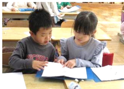
【写真5 言葉ブックを活用している様子】

読む力、書く力を高めるためには、語彙を増やす必要がある。そのため、光村図書の「言葉の宝箱」を参考にし、6年間で身に付けたい「事物を表す言葉」「人柄を表す言葉」「心情を表す言葉」を掲載した用語集を作成し、一人一冊配付した。1年生では、気持ちを表す言葉が思いつかないときに使用したことで、思考の助けとなり、児童から「自分では思いつかなかった言葉がたくさん載っている」「言葉ブックがあったから自分の考えが書けた」という声が聞かれた（写真5）。2年生では、物語文の学習で登場人物の人柄を考える活動で使用し、自力ではどのように表現すればよいか分からなかった児童も、言葉ブックを見ることで内容に適した言葉を見つけることができた。3・4・6年生では、作文や授業の振り返りなどを書く際に、言葉ブックの用語を使って書く姿が見られた。また、言葉の意味が分からないものについては、辞書を使って調べるようにしたことで、言葉の意味を理解して活用するだけでなく、普段から積極的に使おうという意識が育った。5年生では、ディベートの学習を通して学んだ言葉や話し方のポイントを新たに追加し、いつでも振り返ることができるようにした。