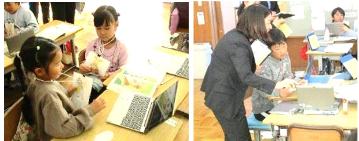
【写真3 ICT機器を活用した話し合いの様子】