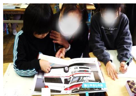
(図4) 1年生「のりものカードでしらせよう」 学習サポーター

学習サポーターは、支援が必要な児童への声かけやサポート(図4)、作文等で使用する掲示物の作成を行った。「書くこと」の学習では、構成メモが完成し作文用紙に文字を起こす際、すぐ書き始められるグループと、前時の続きから始める指導が必要なグループに分かれ、指導する児童を分担し、習熟度別の学習を行った。