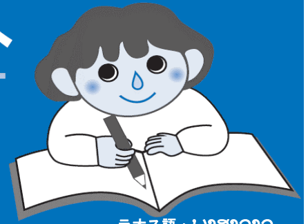
ラオス語：ພາສາລາວ