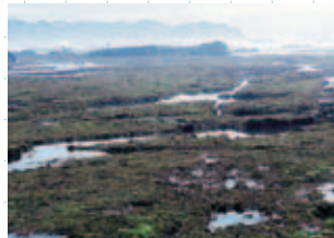
潮だまり (タイドプール)

千葉県は、まわりを水で囲まれています。太平洋岸と東京湾とでは、海の姿が異なります。生物も地域によって異なります。地域の海の様子をじっくり見つめましょう。波の音、風の音、鳥の声を聞いてみましょう。