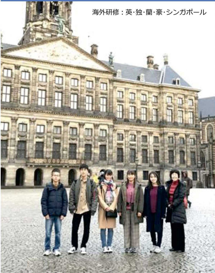
海外研修：英・独・蘭・豪・シンガポール