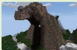
▲ 昨年度の作品 ▲