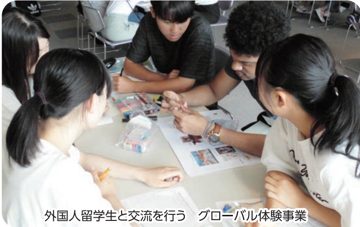
外国人留学生と交流を行う グローバル体験事業

「夢気球」や「県教委ニュース」などの情報は、 千葉県教育委員会のウェブサイトでも ご覧いただけます。