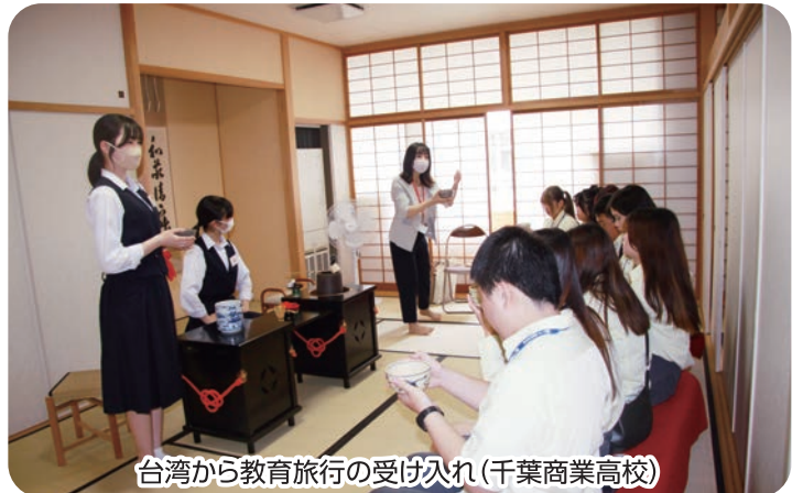
台湾から教育旅行の受け入れ(千葉商業高校)