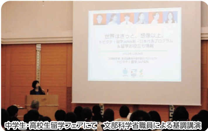
中学生・高校生留学フェアにて 文部科学省職員による基調講演

県教育委員会では、世界を舞台に活躍できる人材の育成を目指し、国際教育交流の推進をはじめ、さまざまな取り組みを行っています。