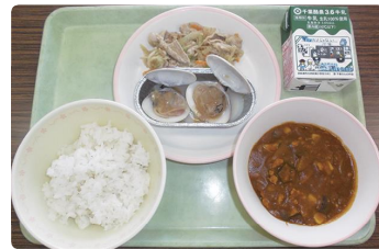
←九十九里町の学校給食 「ハマグリのおねぎだれかけ」