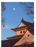
令和2年度館長賞受賞作品