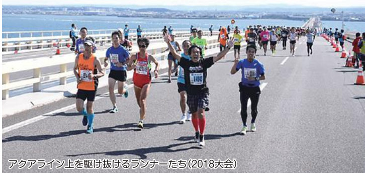
アクアライン上を駆け抜けるランナーたち(2018大会)

4年ぶりとなる今大会では、東京2020オリンピック・パラリンピック大会のレガシーを未来に引き継ぐ一つのステップとして、「スポーツの力」で多くの皆さんが元気になるような大会を目指します。