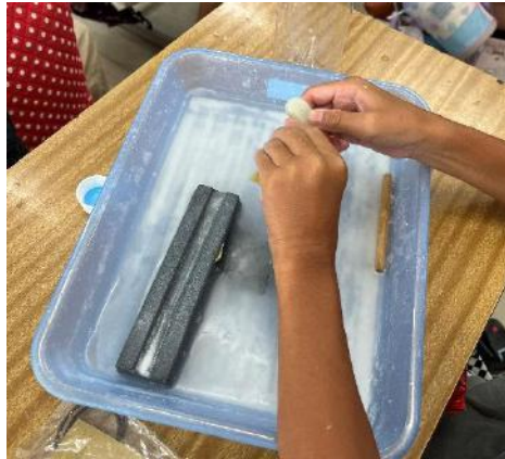
勾玉づくりの様子②