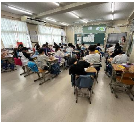
勾玉づくりの様子①