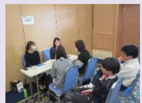
留学を推進・支援する団体による説明会及び個別相談の様子

(一財)海外留学推進協会・(公財)YFU日本国際交流財団・(公財)AFS日本協会・マレーシア政府観光局にご参加いただきました。)