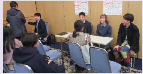
新・日本代表プログラムを活用して留学した高校生による留学体験談及び個別相談の様子