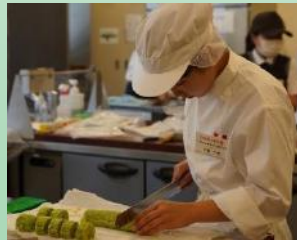
決勝大会作品製作

各学校のウェブページから「県教委ニュース」へのリンクをお願いしています。 バナーもご活用ください。