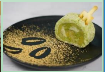
優勝作品『食突モ～進』