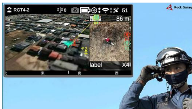
スマートグラスで見る（株式会社ロックガレージ）