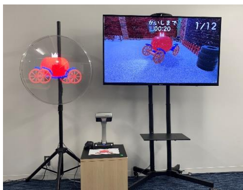
3D ホログラム（X-Gate 株式会社）

タカラガイの3D模型を作る体験や、紙工作で立体作品を作る体験など、イベントも盛りだくさんです。