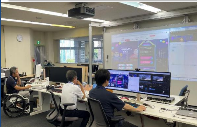
メディア教育棟のICT機器を確認する様子

7月31日（水）に委員が、県総合教育センターを訪問しました。センターの概要説明を受けた後、視聴覚教材や教科書、長期研修生の報告等が整備された施設を視察し、地学観察実験研修、電子黒板やタブレット端末を活用した初任者研修、ICT活用研修等の様子を見学するとともに職員との意見交換を行いました。