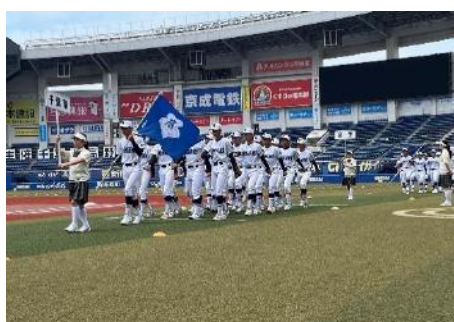
選手全員による一斉前進