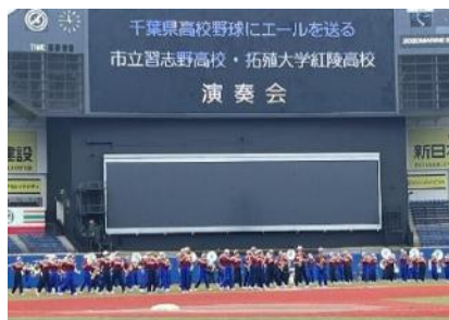
2校合同の演奏で選手にエール