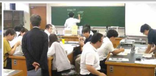
地学観察 研修の様子