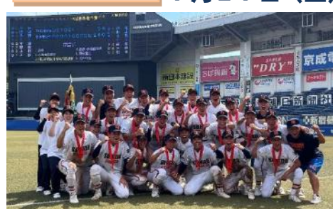
木更津総合高校 激闘を制し甲子園へ