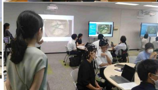
iPad 動画 活用研修 の様子