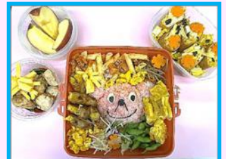
「食品ロスを減らせ! 千産千消弁当」