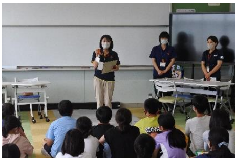
認知症サポート講座