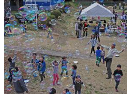
昨年の「ふれあい体験フェスティバル」の様子