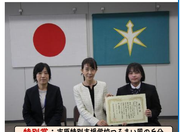
特別賞：市原特別支援学校つるまい風の丘分