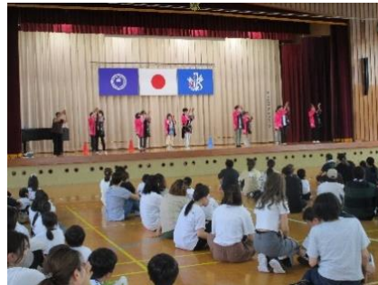
家庭教育学級（「東庄音頭」講習会）