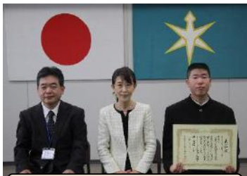
優秀賞：長生特別支援学校