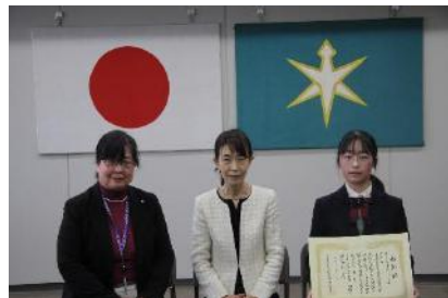
優秀賞：仁戸名特別支援学校