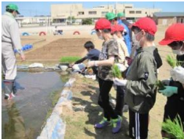
米作り体験（田植え）

本校は、令和2年4月に、東庄町にあった小学校5校（神代小学校、笹川小学校、橘小学校、石出小学校、東城小学校）が統合されてできた学校で、今年で4年目を迎えます。東庄小学校初年度は、新型コロナウイルス感染症の影響により、教育活動が制限された中でのスタートとなりました。今年度は制限が緩和され、様々な教育活動や行事を行うことができます。