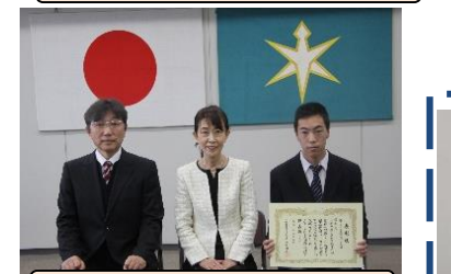
優秀賞：野田特別支援学校