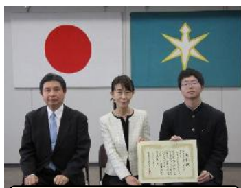
優秀賞：千葉工業高等学校