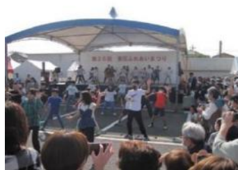
東庄町ふれあい祭