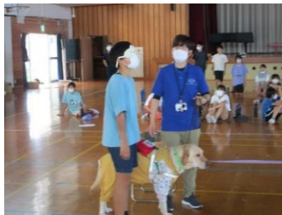
盲導犬協会出張講座