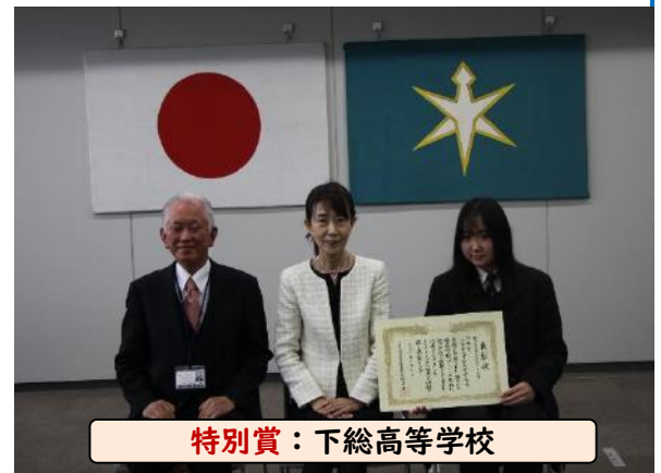
特別賞：下総高等学校