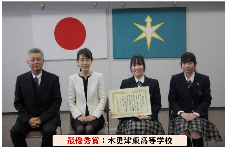
最優秀賞：木更津東高等学校

令和5年度は下記の7校が最優秀賞、特別賞、優秀賞をそれぞれ受賞し、2月6日（火）に表彰式が行われました。