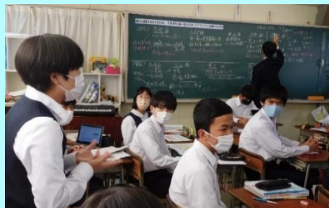
ディベートの様子

この件についてのお問い合わせ 企画管理部 教育政策課 電話043-223-4015