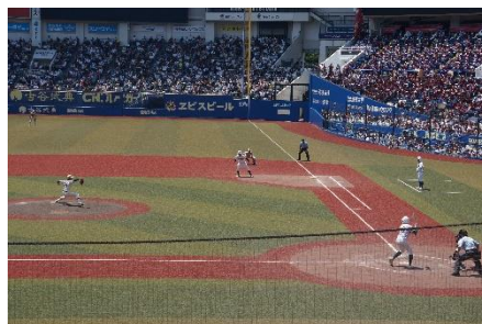
1点を争う緊迫した試合展開