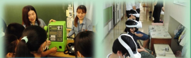
「どうやって使うの？」 公衆電話や黒電話の 使い方を教わりました。