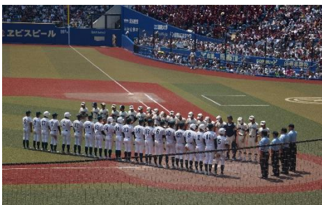
決勝戦 習志野 対 専修大学松戸