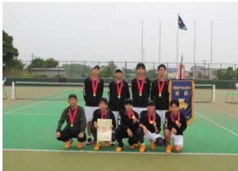
【男子団体優勝 木更津総合高等学校】