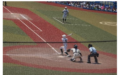
9回2死からのサヨナラヒット