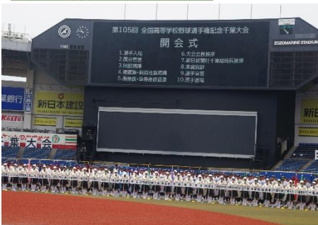
選手全員による一斉前進