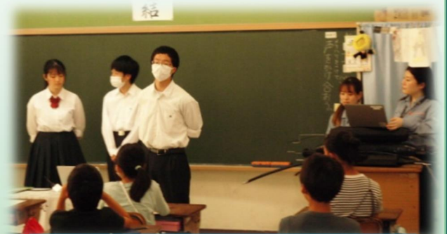
情報技術科の生徒3名とNTT東日本の社員さんが「通信技術」をテーマに授業を行いました。

「100年後の千葉未来会議」とは、高校生と近隣の小中学生が、100年後の千葉県について考える会議。開催時期は高校が設定する。