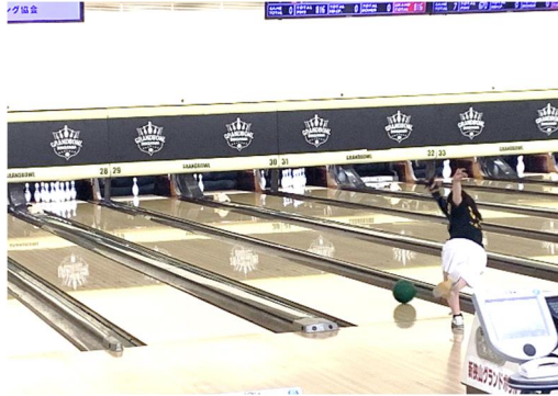
【少年女子団体戦 内野選手】