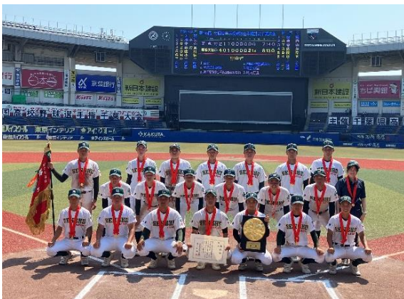
春夏連続の甲子園へ