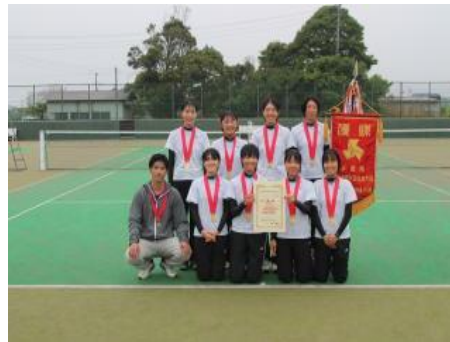
【女子団体優勝 昭和学院高等学校】