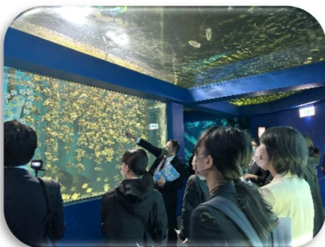
企業 (Xpark) 視察