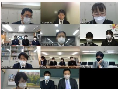
事前研修会 の様子