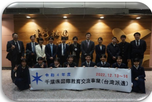
桃園国際空港に到着