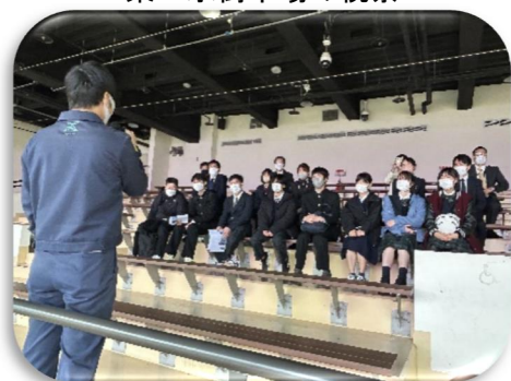
企業の日本人スタッフからの講話