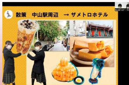
派遣校生徒による 台湾観光プランの 企画提案