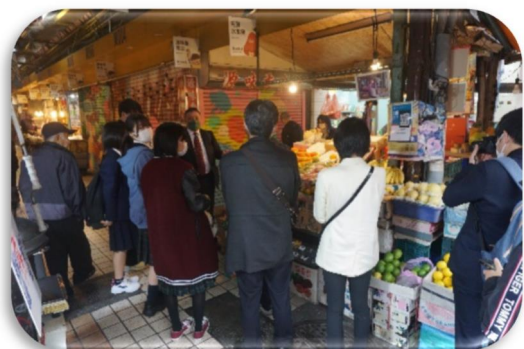
東三水街市場の視察