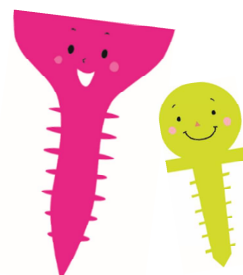
イラスト：はりたつお

橋に使われる巨大なねじや、日本人が初めて出会ったとされるねじ「火縄銃のねじ」、頭蓋骨に直接固定する医療用ねじなど、私たちの生活を支える多種多様な「ねじ」を、展示と体験を通して楽しく、わかりやすく紹介します。