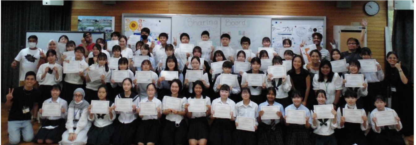
【フェアウェルセレモニー後、修了書を持って全員で記念撮影】