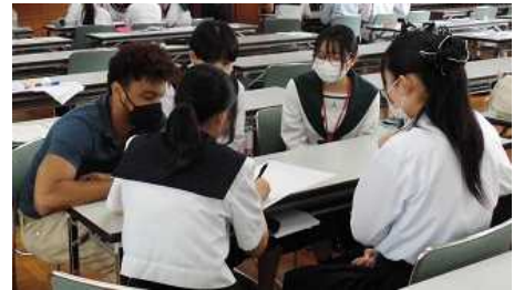
【チームビルディング】