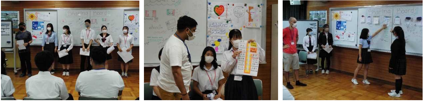
【グループプレゼンテーション】