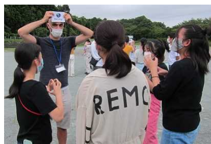
【屋外アクティビティ】