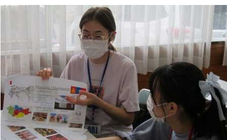
【留学生が母国を紹介】