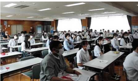
【オープニングセレモニー】