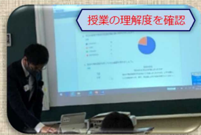
授業の理解度を確認