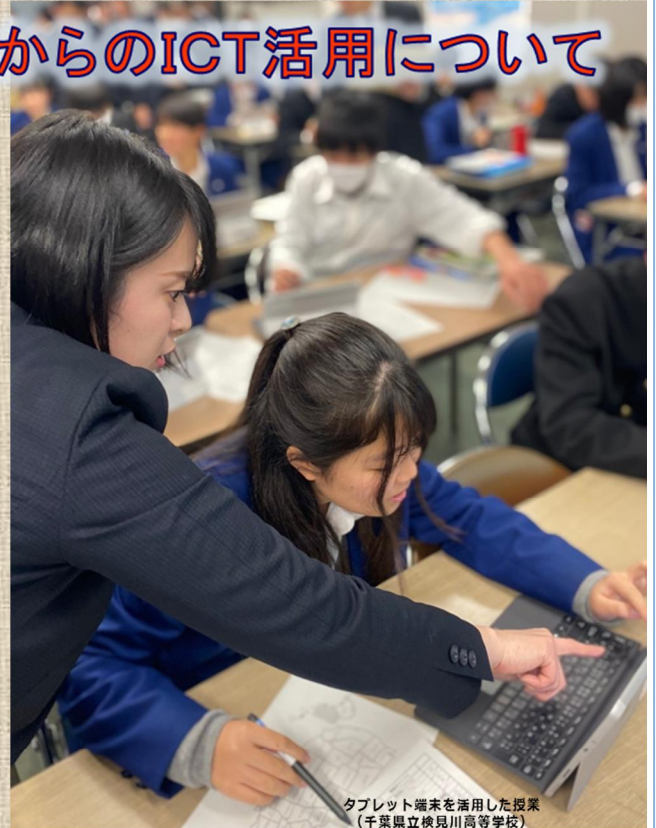
タブレット端末を活用した授業 (千葉県立検見川高等学校)