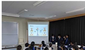
東葛中では3年間探求学習とプレゼンテーションを続けます

お問い合わせ先 千葉県立東葛飾中学校 電話 04-7143-8651 学校公式ホームページ