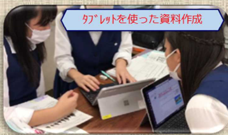
タブレットを使った資料作成