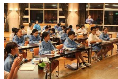
【オリエンテーション合宿】

4 時 間 次の表のように現在通われている小学校のある地域ごとに、参加していただく時間を分けていますので、ご協力ください。