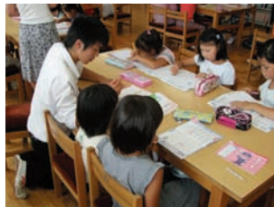
【茂原市立緑ヶ丘小学校】 高校の生徒が、小・中学生のために学習支援やふれあい活動を行います。

We give opportunities to high school students who wish to become teachers to assist classes in neighborhood elementary/junior-high schools as a part of career education