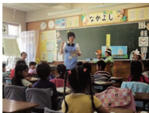
【浦安市立日の出小学校】 役割演技を取り入れた1年生の道徳の授業を公開。

We strive to improve teachers’ teaching abilities by holding an ‘open house’ in every public school in Chiba prefecture mostly in November which is set to be the month to improving scholastic ability.