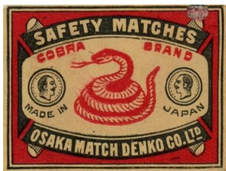
ヘビがあしらわれたマッチラベル