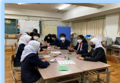
折り紙と言えば「鶴」