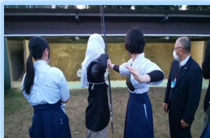
本校が誇る弓道部員が先生役