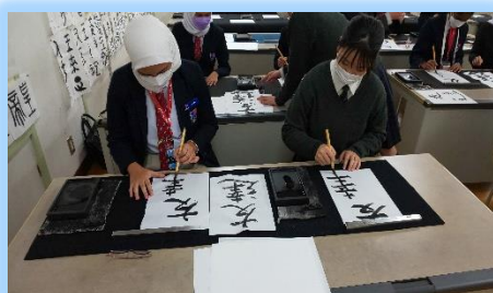
一緒に書いた言葉は「友達」

歓迎式典では、吹奏楽部の演奏やダンス部パフォーマンスを披露し、その後3グループに分かれ、書道、弓道や折り紙といった日本の伝統的な活動を英語でコミュニケーションを図りながら交流を深めました。