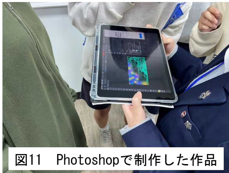
図11 Photoshopで制作した作品