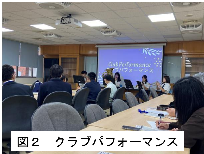
図2 クラブパフォーマンス