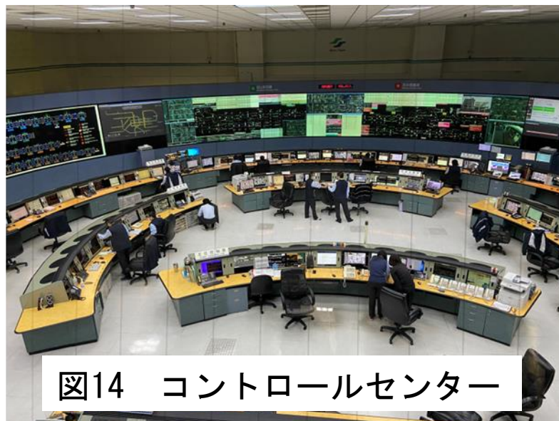
図14 コントロールセンター