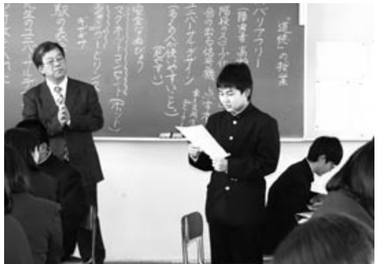
高校の「道徳」を学ぶ時間