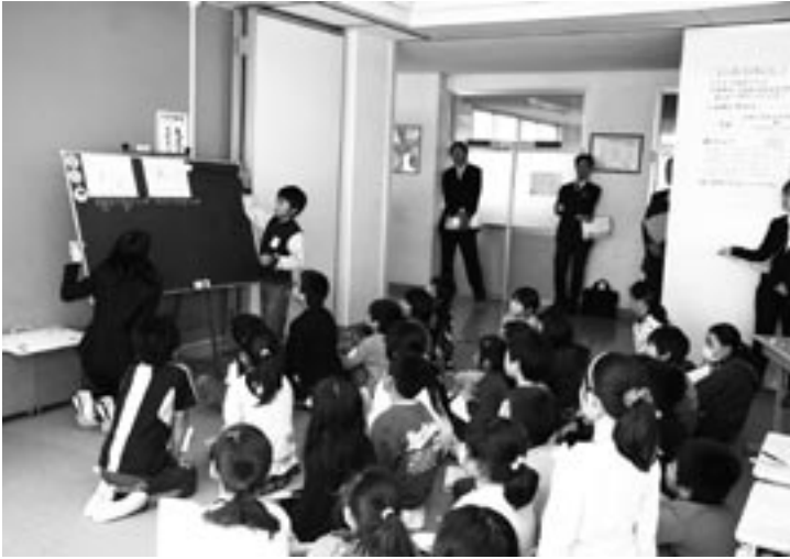
小学校の算数の授業