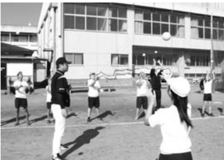
小学校の体育の授業