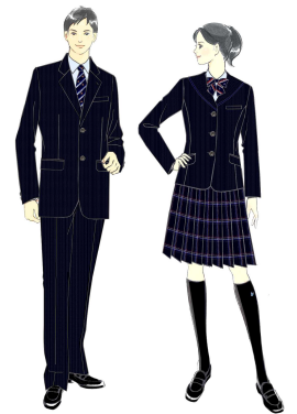
制服のイメージデザイン