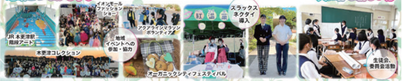
JR 木更津駅階段アート