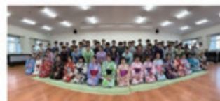
着物の着付け体験