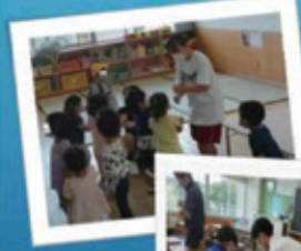
今年は、自分の母校の小中学校、保育所に体験実習に行きました。