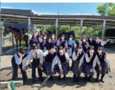
一宮乗馬センターにて

令和6年度入学生から「観光に関するコース」を設置することになりました。地域の観光の活性化を目指します。