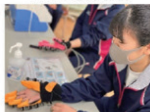
福祉ロボット体験