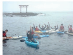
マリンスポーツ体験