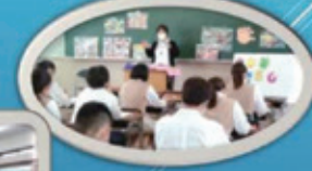
大学の先生から、道徳教育や特別支援教育などについて学びました。