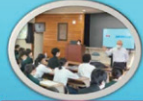
町教育長や保育所の先生を講師に招き、お話をいただきました。