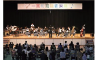
一宮町芸能音楽祭の吹奏楽部