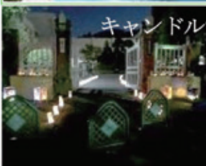
キャンドルナイト in 八鶴湖