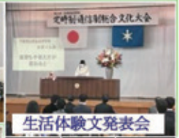
生活体験文発表会