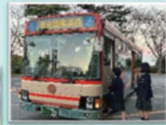
直行バス(学校~東金駅) 片道 220円