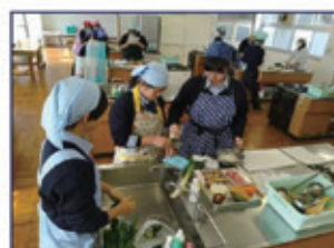
フードデザイン専攻