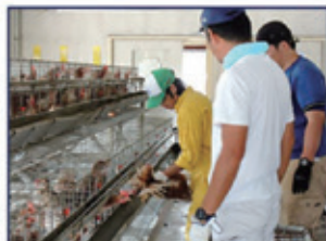
養鶏専攻(鶏の出荷作業)