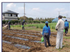
野菜専攻(路地野菜の植え付け)

1年次は農業全般を学び、2年次以降は野菜・果樹・草花・フードデザインの専攻に分かれて学びます。