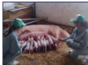
養豚専攻(豚の飼育・管理)