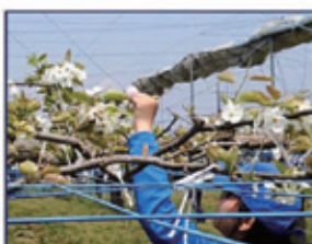
果樹専攻(ナシ園管理)