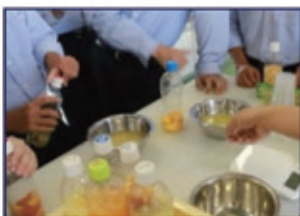
製造コース(発酵実験)

1年次は製造・情報について幅広く学び、2年次以降は製造コース・情報コースに分かれて学びます。