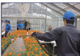
草花専攻(草花の栽培)