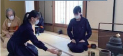
増尾地域ふるさと祭り