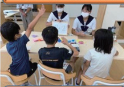
夏休み子ども算数教室