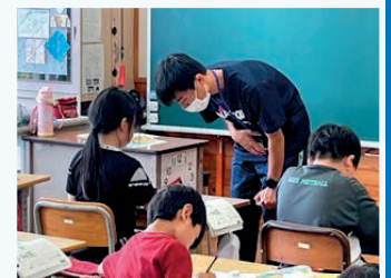
成東高校の生徒による小学校での出前授業の様子