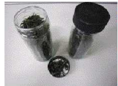
出来上がったお茶