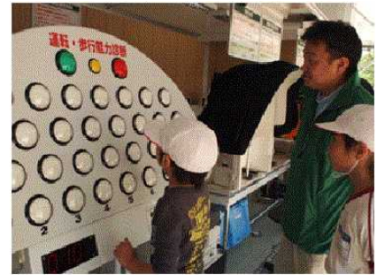
『ちとらくん』の中の様子