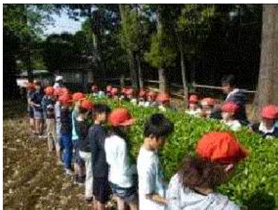
茶摘みをする子ども達