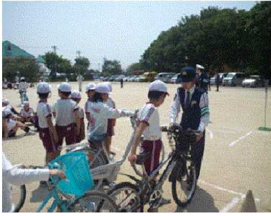
自転車の安全な乗り方