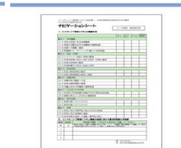
ナビゲーションシート

「インクルCOMPASS」の構成として、「体制整備」「教育課程」「交流及び共同学習」「研修」等の項目別に確認できる「チェックを行うシート」と全体像をつかむための「ナビゲーションシート」の2種類があります。活用の仕方としては、以下のとおりです。