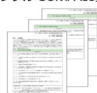
チェックを行うシート