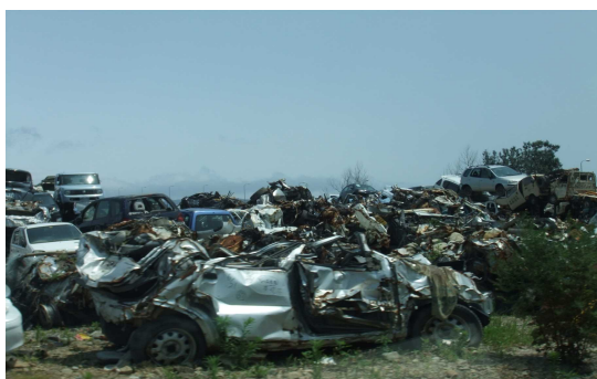
【今も残る たくさんのがれき】