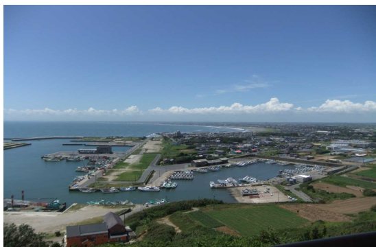
【飯岡刑部岬から見た飯岡漁港】