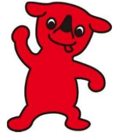
千葉県マスコット キャラクターチーバくん