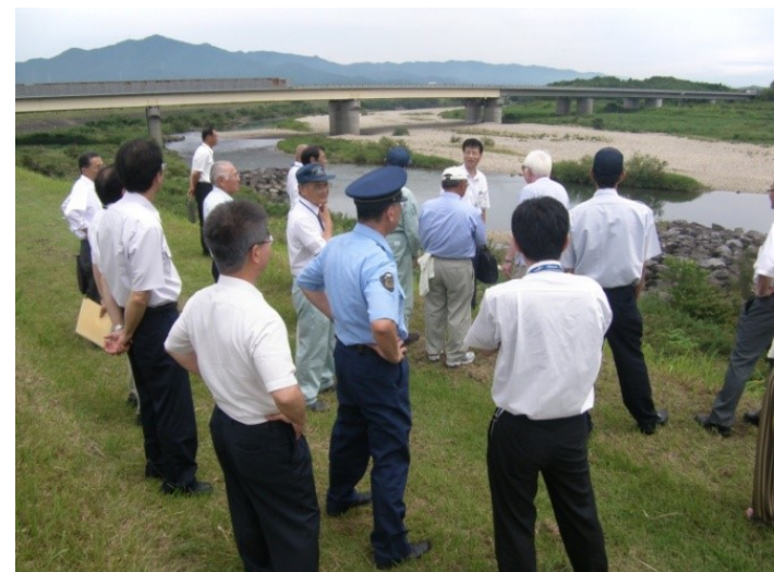
合同巡視 (水難事故防止連絡協議会)