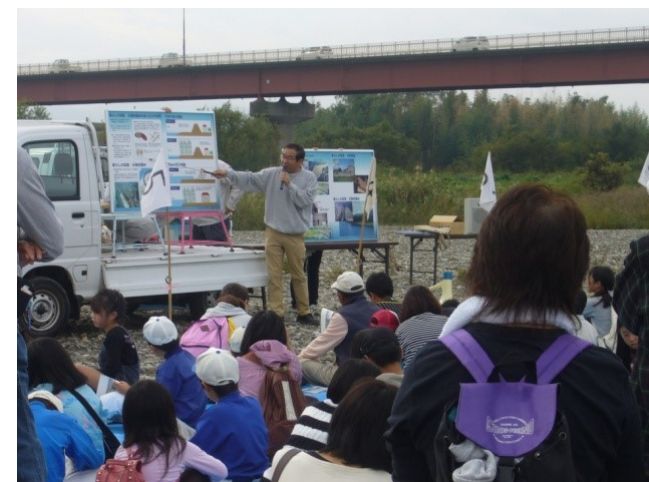
出前講座や安全 講習会の実施

(河川水難事故防止HP) http://www.mlit.go.jp/river/kankyo/anzen/index.html