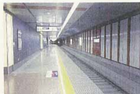
平成21年11月14日から 新しい上りホームを使用開始 した空港第2ビル駅