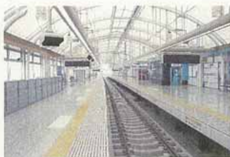
平成21年10月3日から 3階の新しい下りホームを 使用開始した日暮里駅