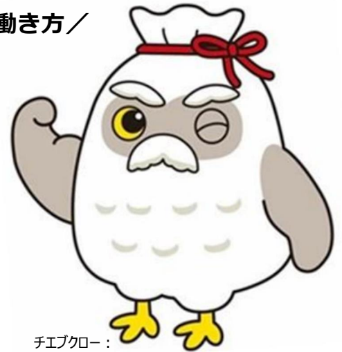
チエブクロー： シルバー人材センターのマスコットキャラクター