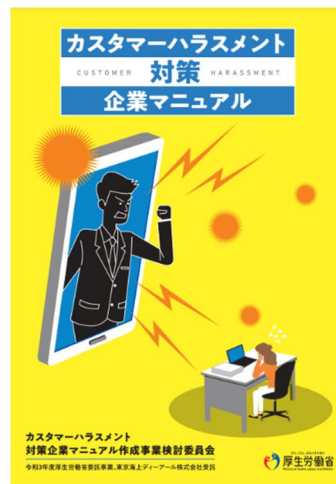
カスタマーハラスメント対策企業マニュアル