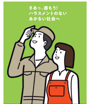
カスタマーハラスメント対策リーフレット