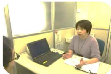
カウンセリングブース