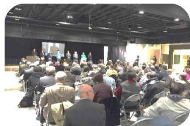
再就職支援セミナー

また、市町村と連携し、県内のさまざまな地域に出張してセミナーや個別相談などを実施しています。