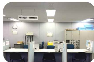
ハローワークコーナー

ハローワーク相談員が常駐し、求人の情報提供や紹介状の発行をします。また、求人検索端末も8台完備しているため、ゆっくり検索ができます。