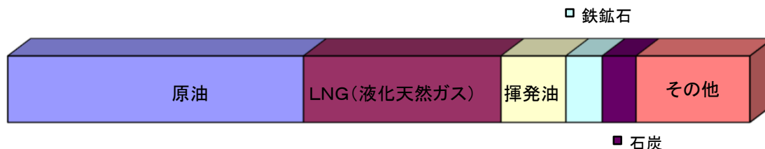
■輸入貨物主要品種別表