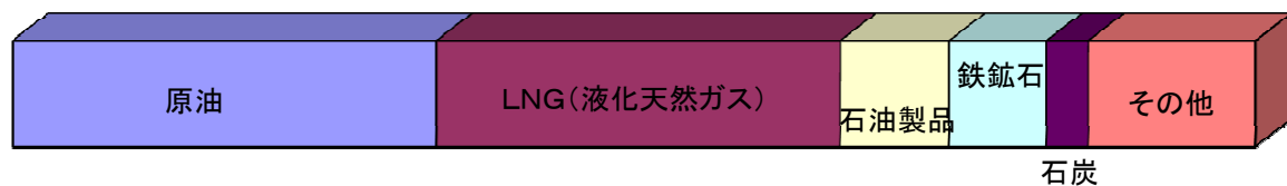
■輸入貨物主要品種別表