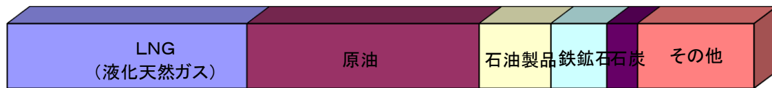
■輸入貨物主要品種別表